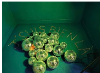
Expositions des étudiant-es de la classe préparatoire lors des Journées Portes Ouvertes 2024